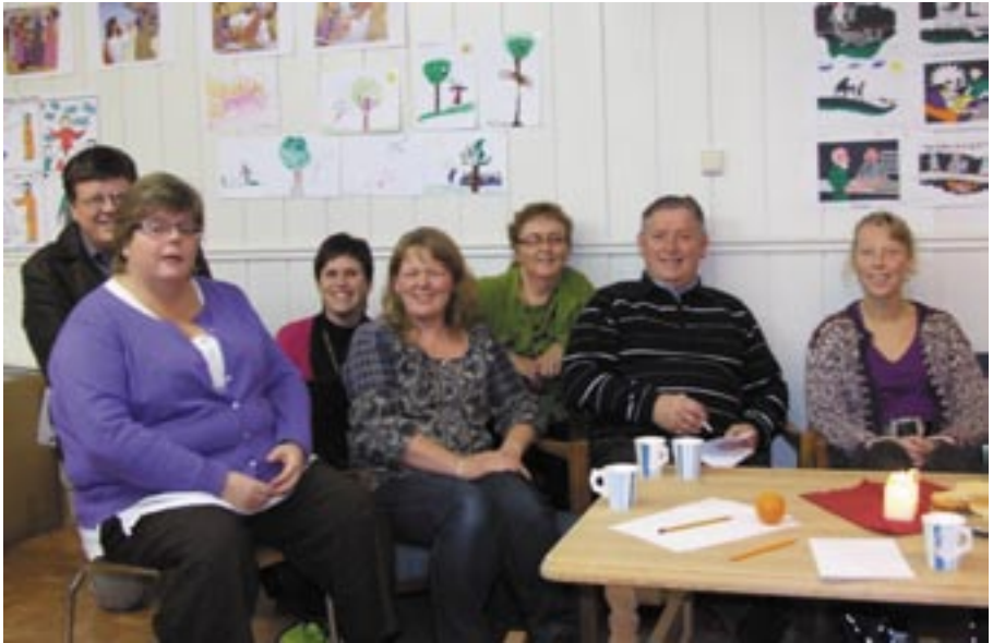
Her er noen av lederne under planlegging av torsdagsatsingen.

Planleggingen er allerede godt i gang for det nye klubbtilbudet i menighetshuset. Det startet med tanken om å flytte søndagsskolen til en hverdag, så det skulle bli lettere å bli med for de som er bortreist i helgene også. Så har planene utviklet (og innviklet?) seg til å bli et tilbud for ALLE som ikke har begynt på ungdomsskolen ennå!