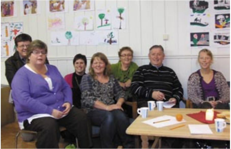
Her er noen av lederne under planlegging av torsdagsatsingen.

Planleggingen er allerede godt i gang for det nye klubbtilbudet i menighetshuset. Det startet med tanken om å flytte søndagsskolen til en hverdag, så det skulle bli lettere å bli med for de som er bortreist i helgene også. Så har planene utviklet (og innviklet?) seg til å bli et tilbud for ALLE som ikke har begynt på ungdomsskolen ennå!