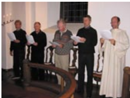
Sangere fra Sauherad og Nes kantori