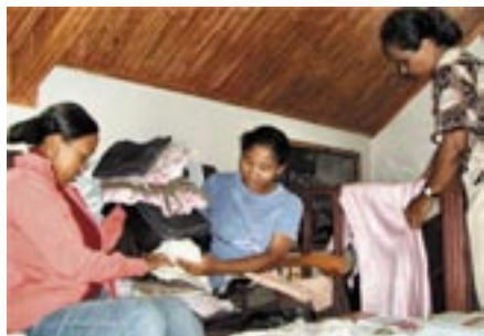
Noen av jentene viser frem arbeidet sitt

Det var nøye regnet ut at det var det de trengte.