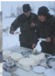
Snøhuleovernatting m/bløtkake for friluftskonfirmantene!

Etter pakking og rydding av leiren, gjensto kun en flott nedfart på ski tilbake til Jønnebu.