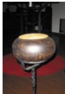
Den nye bønnekrukka i kirken

Dersom en ønsker at bønneønsket skal tas med i forbønnen i gudstjenesten, skriver en dette på lappen.