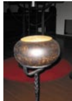
Den nye bønnekrukka i kirken

Dersom en ønsker at bønneønsket skal tas med i forbønnen i gudstjenesten, skriver en dette på lappen.