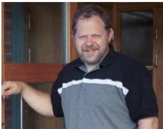
Kurset på Aas

Norpilot egner seg for både store og små fellesskap som vil utvikle seg videre, eller som vil starte noe nytt. Kurskvelder består av undervisning, samtale, bønn og arbeid i grupper og det er også lagt opp til et måltidsfellesskap.